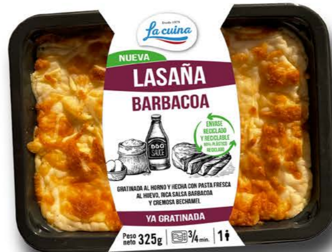
78012 Lasaña Barbacoa