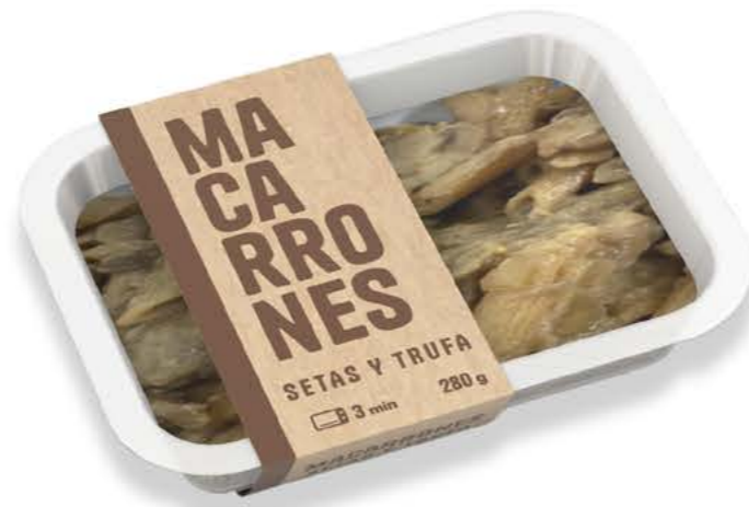
78048 Macarrones con setas y trufa