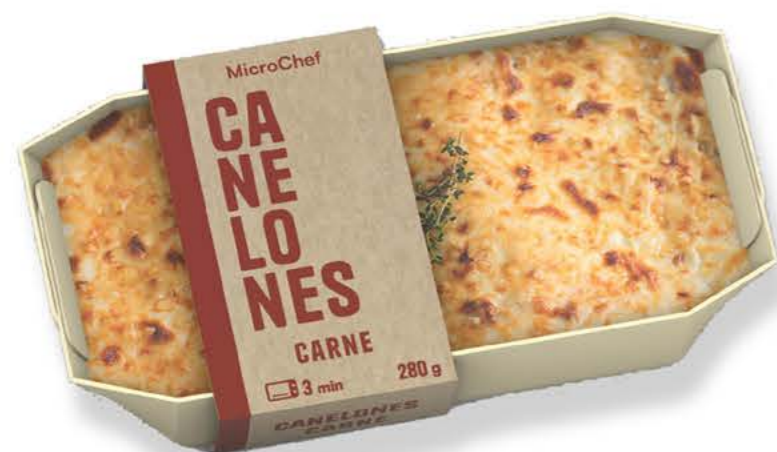
78021 Canelones de Carne

Siguiendo los pasos de la tradicional receta italiana, elaboramos dos recetas de deliciosos canelones, utilizando la mejor pasta fresca y una salsa bechamel. Perfectos para entre semana o una ocasión especial.