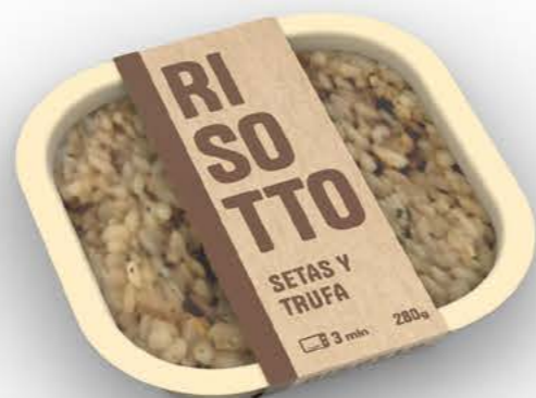
78081 Risotto de setas y trufa Receta casera