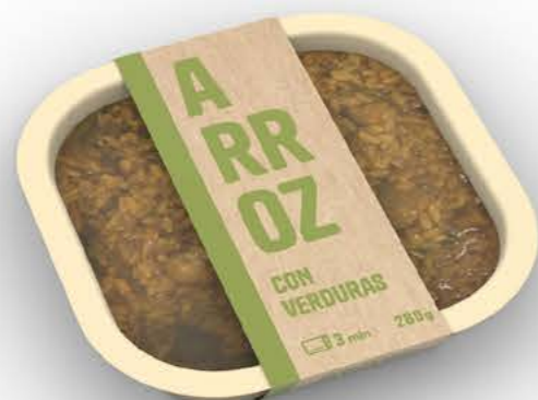
78081 Arroz con verduras Receta casera