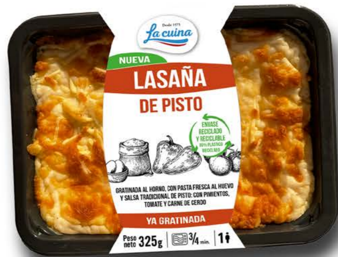
78013 Lasaña de Pisto