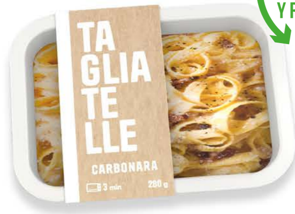
78042 Tagliatelle Carbonara