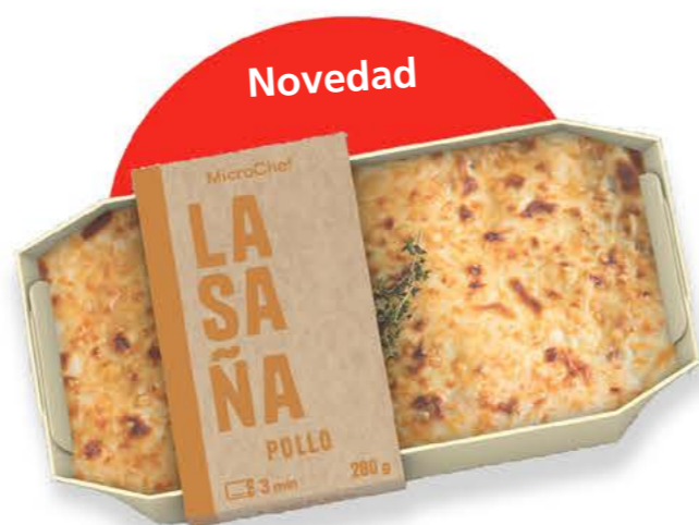
78004 Lasaña de Pollo