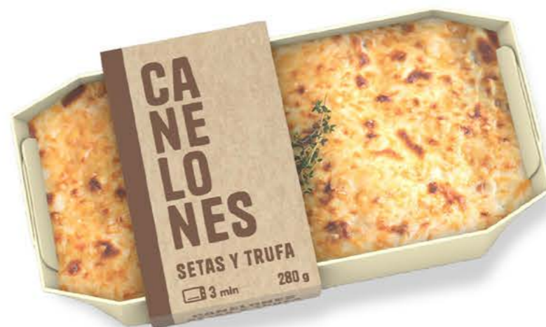
78022 Canelones Setas y Trufa