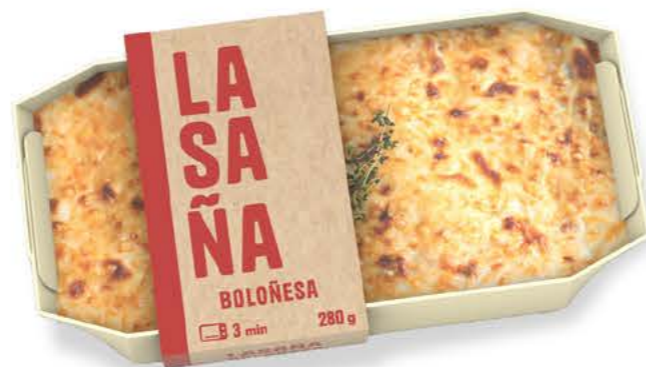
78001 Lasaña Boloñesa