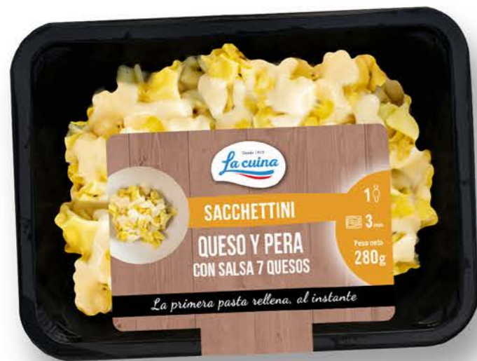
78074 Sacchettini con queso y pera