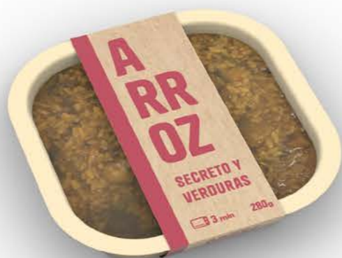
78081 Arroz de secreto con verduras Receta casera