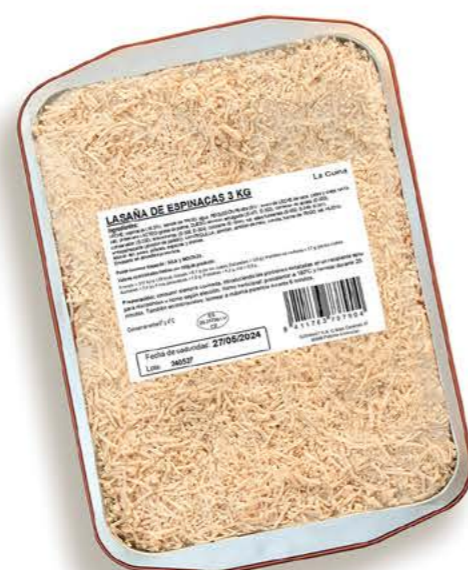
78081 Lasaña de espinacas 3kg Receta casera