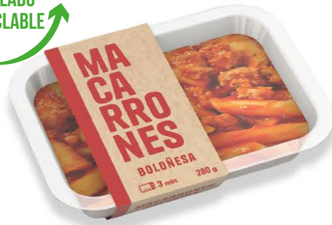
78041 Macarrones Bolognese