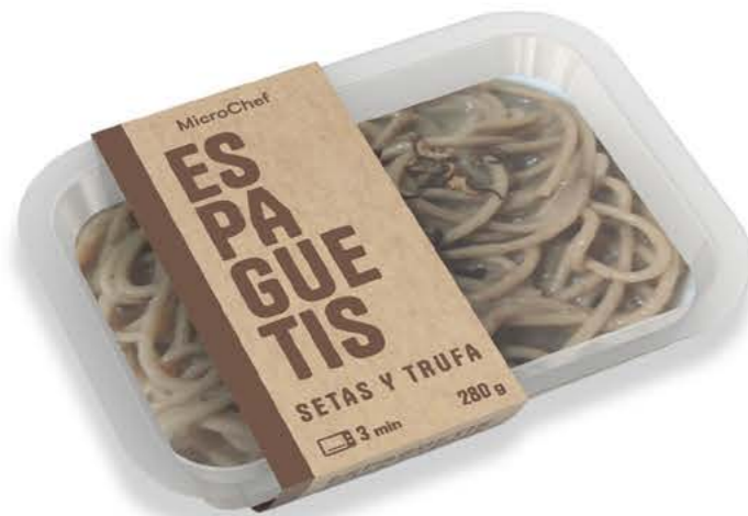
78049 Espaguetis con setas y trufa