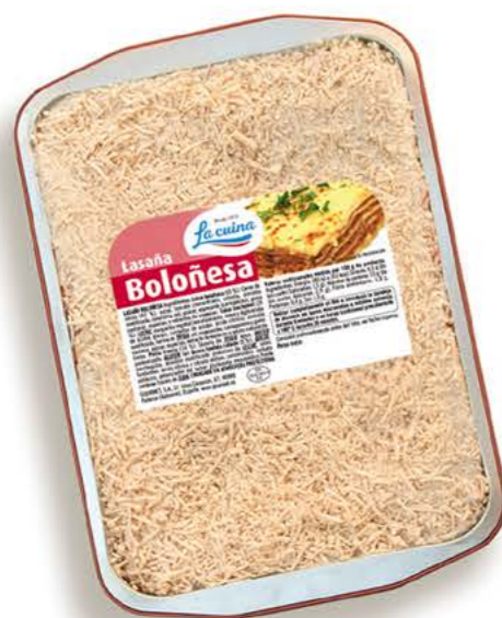
78081 Lasaña Boloñesa 3kg Receta casera