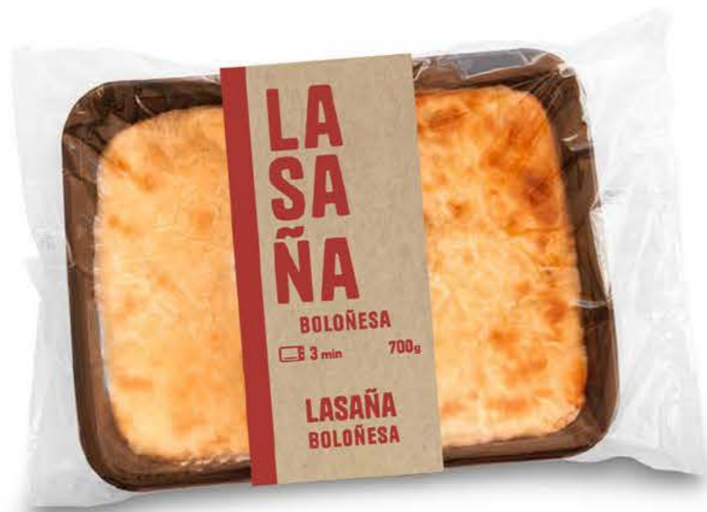
78011 Lasaña Boloñesa 700g