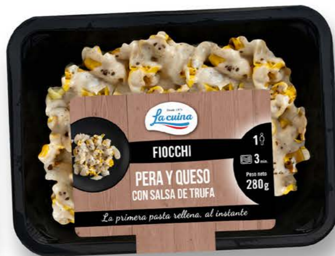
78072 Fiocchi con pera y queso