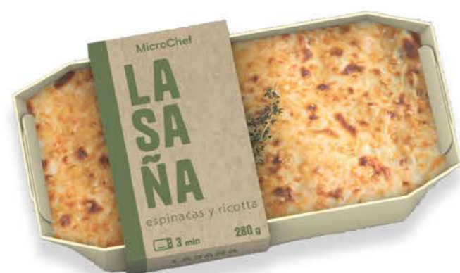
78002 Lasaña Espinacas y Ricotta

Deliciosas recetas, con ingredientes naturales que van desde el auténtico sabor tradicional "boloñesa, la lasaña por excelencia, hasta una suave y rica tentación, una perfecta combinación de espinacas y ricotta, que confiere a esta propuesta una nueva dimensión de sabor.