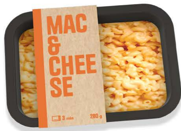
78031 Mac and Cheese

Lanzamos nuestra primera pasta gratinada, con la ruptura de lo convencional. Unos macarrones con sabrosa mezcla de quesos y salsa cheddar que están listos en tres minutos.