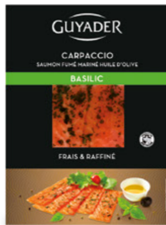
Carpaccio de Salmón ahumado al albahaca Unidades caja: 6 Peso neto: 100 g