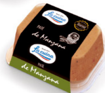
Paté de manzana Unidades caja: 6 Peso neto: 130 g.