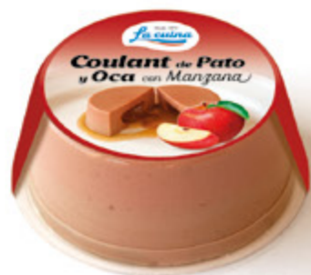
Coulant de Pato / Oca con Manzana Unidades caja: 6 Peso neto: 165 g.