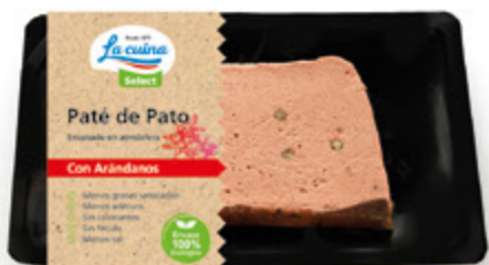
Paté de Pato 100% con Arándanos Unidades caja: 8 Peso neto: 100 g.