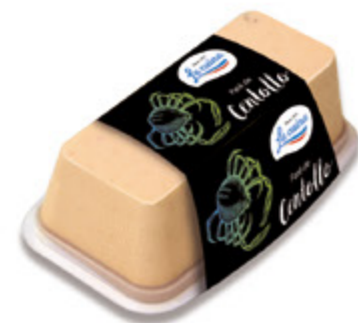
Paté de Centollo Unidades caja: 6 Peso neto: 190 g.