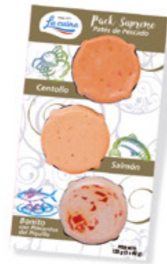
Pack Suprem de Pescado: de Centollo, de Salmón y de Bonito con Pimientos del Piquillo Unidades caja: 12 Peso neto: 120 g. (3 x 40 g)