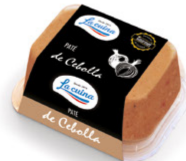
Paté de cebolla Unidades caja: 6 Peso neto: 130 g.