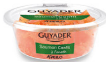
Salmón ahumado marinado al eneldo y limón Unidades caja: 6 Peso neto: 80 g