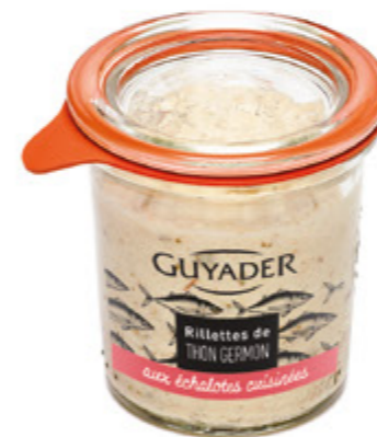
Rilette de Atún Blanco Unidades caja: 6 Peso neto: 100 g.