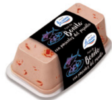
Paté de Bonito con pimientos del piquillo Unidades caja: 6 Peso neto: 190 g.