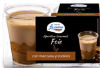
Aperitivo Gourmet Foie con manzana y cookies Unidades caja: 6 Peso neto: 80 g. (2x40)