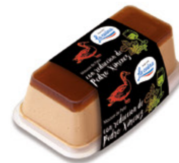
Mousse de Pato con reducción de Pedro Ximenez Unidades caja: 6 Peso neto: 190 g.