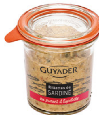
Rilette de Sardina al pimiento de l'Espelette Unidades caja: 6 Peso neto: 100 g.