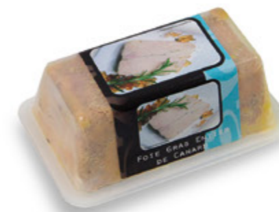
Foie Gras de Pato Entero Unidades caja: 6 Peso neto: 200 g.