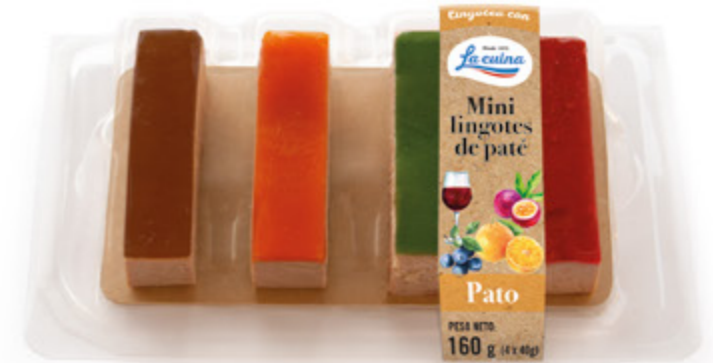
Mini Lingotes de Pato: Fruta de la Pasión, Arándanos, Naranja y Reducción Pedro Ximenez Unidades caja: 6 Peso neto: 160 g. (4 x 40 g)