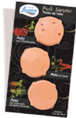
Pack Suprem de Pato: Con Frambuesa, al Cava y con reducción de Pedro Ximenez Unidades caja: 12 Peso neto: 120 g. (3 x 40 g)