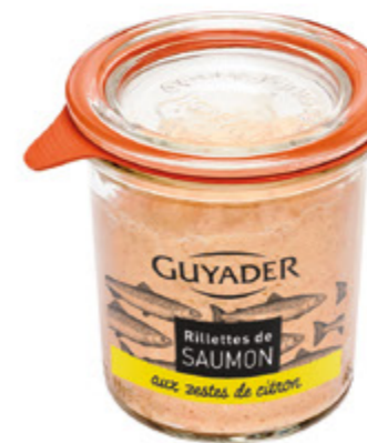
Rilette de Salmon al limón Unidades caja: 6 Peso neto: 100 g.