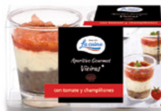
Aperitivo Gourmet Vieiras, con tomate y champiñones Unidades caja: 6 Peso neto: 80 g. (2x40)