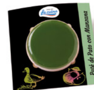
Paté de Pato con Manzana Unidades caja: 10 Peso neto: 100 g.