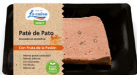
Paté de Pato 100% con Fruta de la Pasión Unidades caja: 8 Peso neto: 100 g.