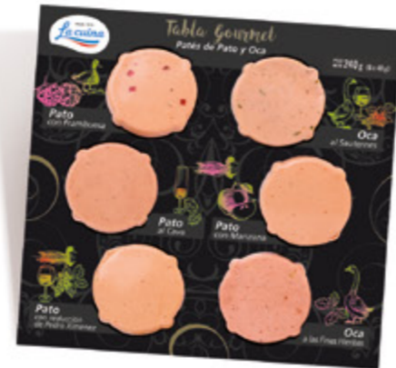
Tabla Gourmet de patés de Pato y Oca Pato con frambuesa, oca al sauternes, pato al cava, pato con manzana, pato con reducción de Pedro Ximenez, oca a las finas hierbas Unidades caja: 9 Peso neto: 240 g. (6 x 40 g)