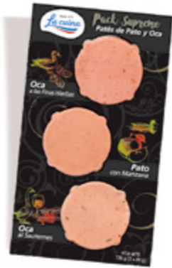
Pack Suprem de Pato y Oca: Oca a las Finas Hierbas, Pato con Manzana y Oca al Sauternes Unidades caja: 12 Peso neto: 120 g. (3 x 40 g)