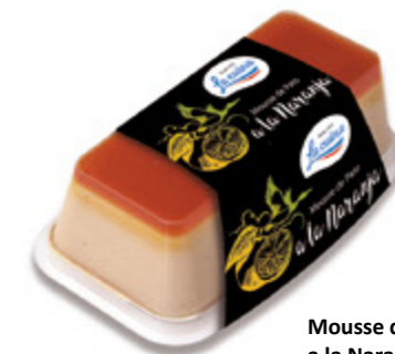
Mousse de Pato a la Naranja Unidades caja: 6 Peso neto: 190 g.