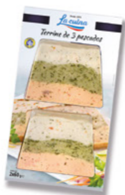
Terrine de 3 pescados Unidades caja: 6 Peso neto: 120 g. (2x60)