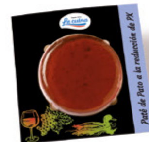
Paté de Pato a la reducción de Pedro Ximenez Unidades caja: 10 Peso neto: 100 g.