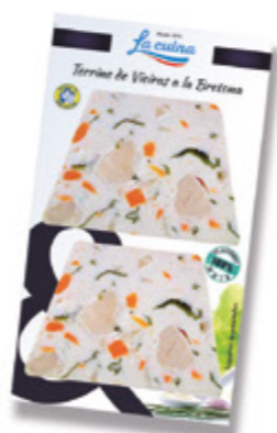
Terrine de Vieiras a la Bretona Unidades caja: 6 Peso neto: 120 g. (2x60)