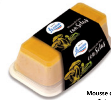
Mousse de Pato con Setas Unidades caja: 6 Peso neto: 190 g.