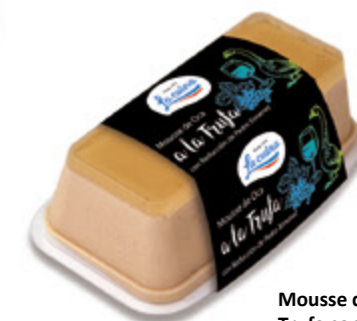
Mousse de Oca a la Trufa con reducción de Pedro Ximenez Unidades caja: 6 Peso neto: 190 g.