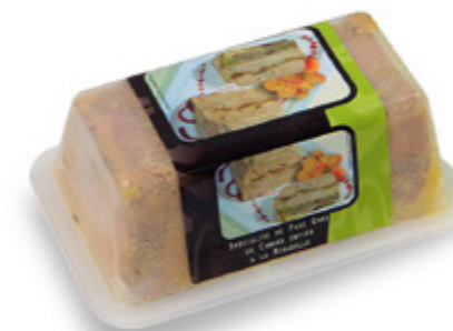
Foie Gras de Pato con Ciruela Mirabelle Unidades caja: 6 Peso neto: 200 g.