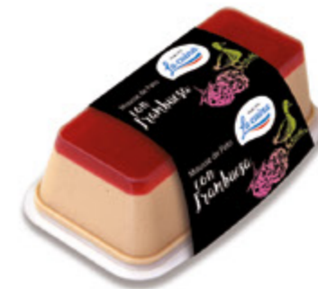
Mousse de Pato con Frambuesa Unidades caja: 6 Peso neto: 190 g.