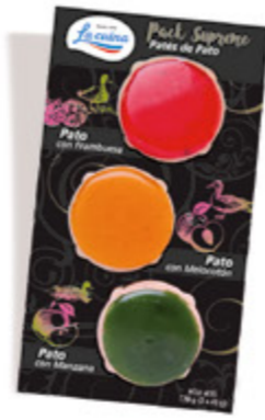
Pack Suprem de Pato: Con Frambuesa, con Melocotón y con Manzana Unidades caja: 12 Peso neto: 120 g. (3 x 40 g)