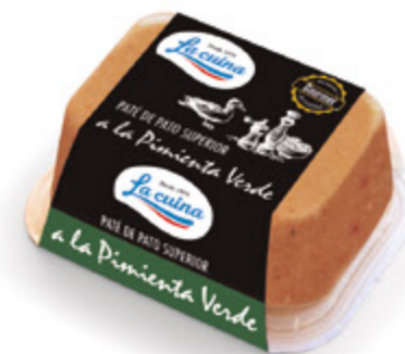
Paté de Pato Superior a la Pimienta Verde Unidades caja: 6 Peso neto: 130 g.