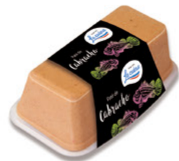
Paté de Cabracho Unidades caja: 6 Peso neto: 190 g.