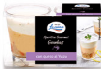
Aperitivo Gourmet Gambas con queso al yuzu Unidades caja: 6 Peso neto: 80 g. (2x40)