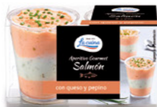
Aperitivo Gourmet Salmón con queso y pepino Unidades caja: 6 Peso neto: 80 g. (2x40)