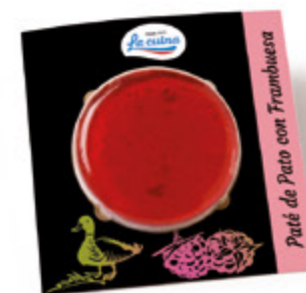
Paté de Pato a la Frambuesa Unidades caja: 10 Peso neto: 100 g.