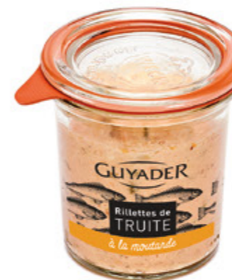
Rilette de trucha a la mostaza Unidades caja: 6 Peso neto: 100 g.