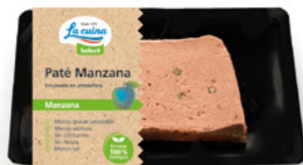
Paté de Manzana Unidades caja: 8 Peso neto: 100 g.