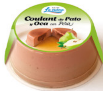
Coulant de Pato / Oca con Pera Unidades caja: 6 Peso neto: 165 g.