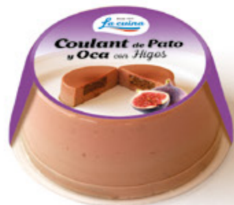
Coulant de Pato / Oca con Higos Unidades caja: 6 Peso neto: 165 g.