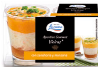
Aperitivo Gourmet Vieiras con zanahoria y manzana Unidades caja: 6 Peso neto: 80 g. (2x40)