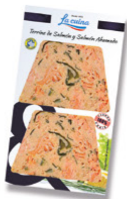
Paté de Salmón y Salmón ahumado Unidades caja: 6 Peso neto: 120 g. (2x60)