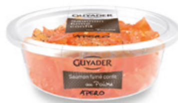
Hojas de Salmón Ahumado Unidades caja: 6 Peso neto: 80 g