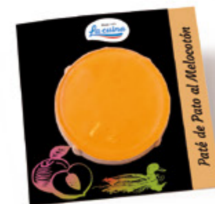
Paté de Pato al Melocotón Unidades caja: 10 Peso neto: 100 g.