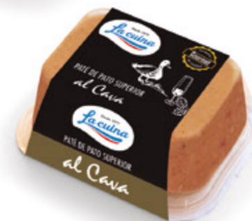
Paté de Pato Superior al Cava Unidades caja: 6 Peso neto: 130 g.